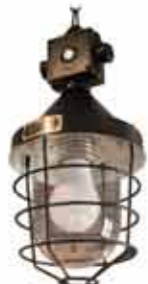
参考:インダストリアルスタイル