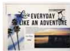
参考:カリフォルニアスタイル