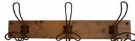
参考:ブルックリンスタイル