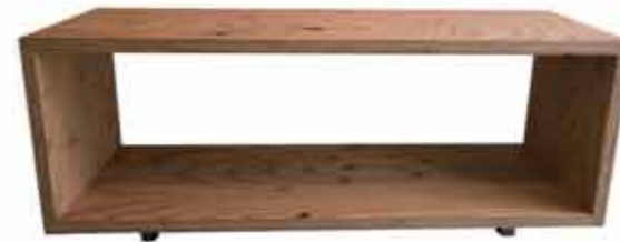
参考:ポタニカルスタイル