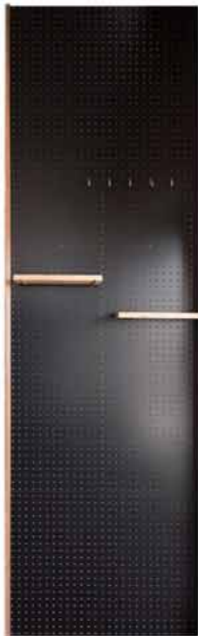
参考:ブルックリンスタイル