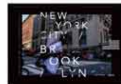
参考:ブルックリンスタイル