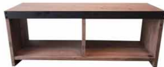
参考:ブルックリンスタイル