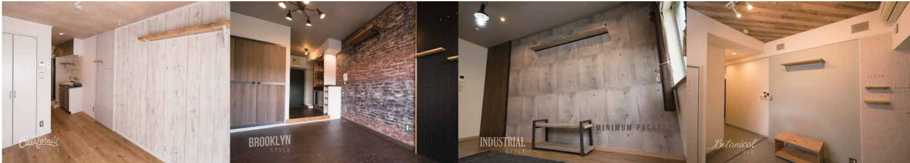
波の音が聴こえそうな空間

適用するルームスタイルは、現況をよく観察して、最も合ったスタイルを、家と冒険が考えて、ご提案します。