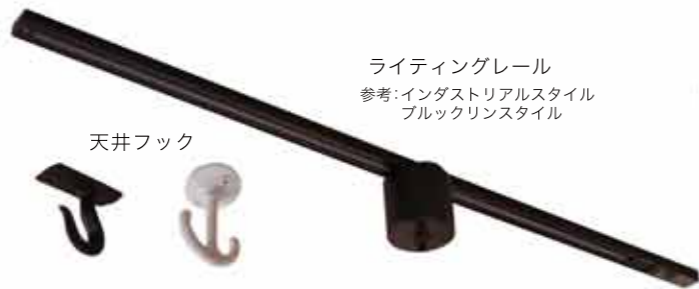
参考:インダストリアルスタイル ブルックリンスタイル