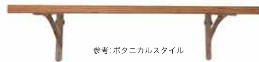
参考:ポタニカルスタイル

スタイリングツールに含まれるアイテム(仕様・デザイン)は、変更されることがあります。